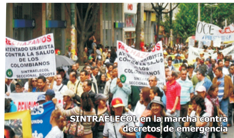
SINTRAELECOL en la marcha contra decretos de emergencia

La ley 100 del mismo Sr. Uribe, desde el principio ha sido ineficiente e inconveniente para resolver los problemas de salud de los colombianos además totalmente en desequilibrio, porque privilegia el lucro privado por encima de derechos fundamentales como la salud y la dignidad humana. Con los decretos de la Emergencia Social, el bienestar de los colombianos ha sufrido el golpe más perjudicial, pues es inconcebible que un sistema sanitario como el nuestro, en el que la gran mayoría de los usuarios son pobres y miserables con pocas oportunidades de empleo y creciente informalidad laboral, sólo se les responda por las enfermedades de bajo costo.