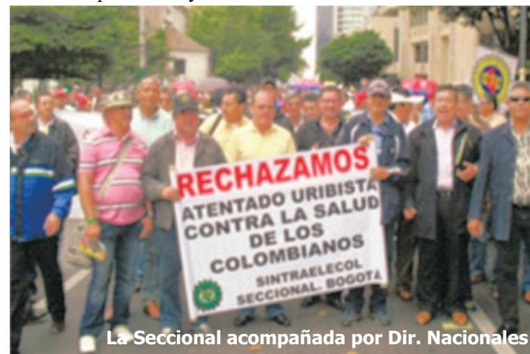
La Seccional acompañada por Dir. Nacionales

No caben dudas que las PES serán financiadas por el bolsillo de los pacientes y es muy posible que la muerte y las complicaciones sean anteriores al fallo de tales comités y a la prestación de la atención. Todo esto es contrario a cualquier enfoque de protección social y al papel del Estado como protector natural de las clases trabajadoras, sin embargo, el gobierno considera la Emergencia Social como "generosa", porque ofrece "facilidades de pago" mediante créditos bancarios respaldados con el patrimonio personal y familiar del usuario, o poder pagar la atención con sus cesantías, fondos de pensiones y otros ahorros.